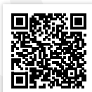
Information Vorteile Mitgliedschaft

Alle Infos und Formulare finden Sie auf unserer Website.