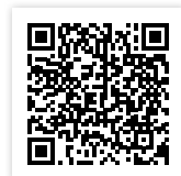
Statuten des Verbandes