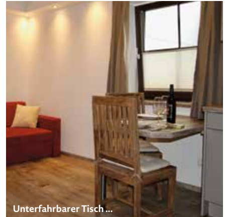
Unterfahrbarer Tisch ...