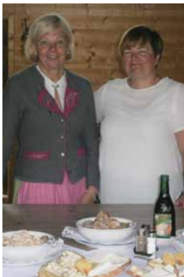
Vermieterinnen bei der Labestation