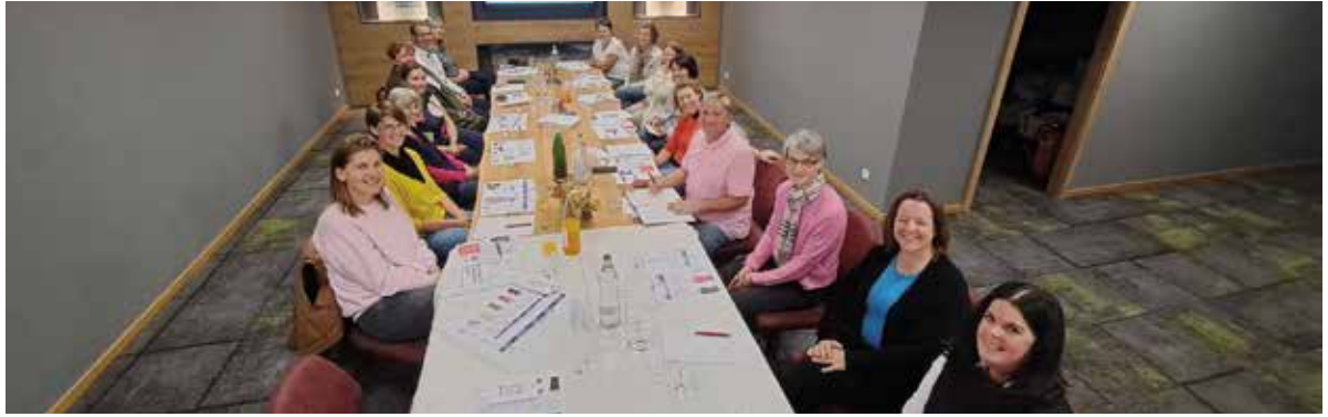
Vermieterstammtisch im TVB