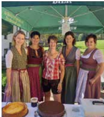
Ausschank beim Bauernherbstfest