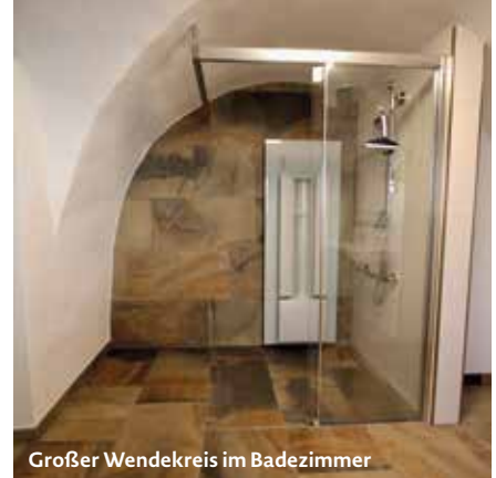
Großer Wendekreis im Badezimmer

Vielen Dank, Hermann, dass du dir die Zeit für uns genommen hast. Wir wünschen dir weiterhin alles Gute und viel Erfolg für die bevorstehende Parabob-Saison!