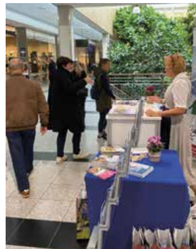
Messestand und Katalogverteilung im Einkaufszentrum in Regensburg