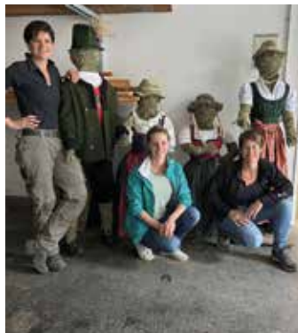
Gestaltung der Bauernherbstdeko Lofer