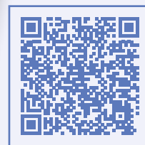
Partnerbetriebe & Konditionen